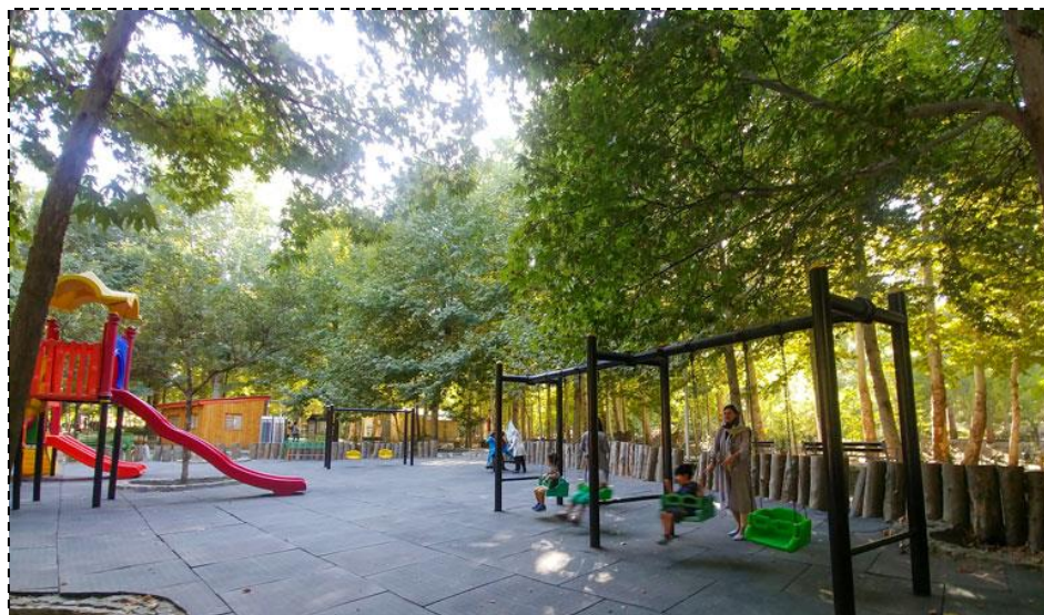
شکل ۲: تصویری از باغ وکیل آباد شهر مشهد

باغ وکیل آباد به مساحت ۲۵۹۶۵۹ مترمربع با آب قنات آبیاری می شود. شهرداری با احداث خیابان، جدول بندی، کف سازی معابر، ایجاد آب نما، برق کشی، اقامتگاه های موقت، باغ وحش، وسایل بازی کودکان و کافه رستوران توانسته جاذبه های این پارک را افزایش دهد (شکل ۲).